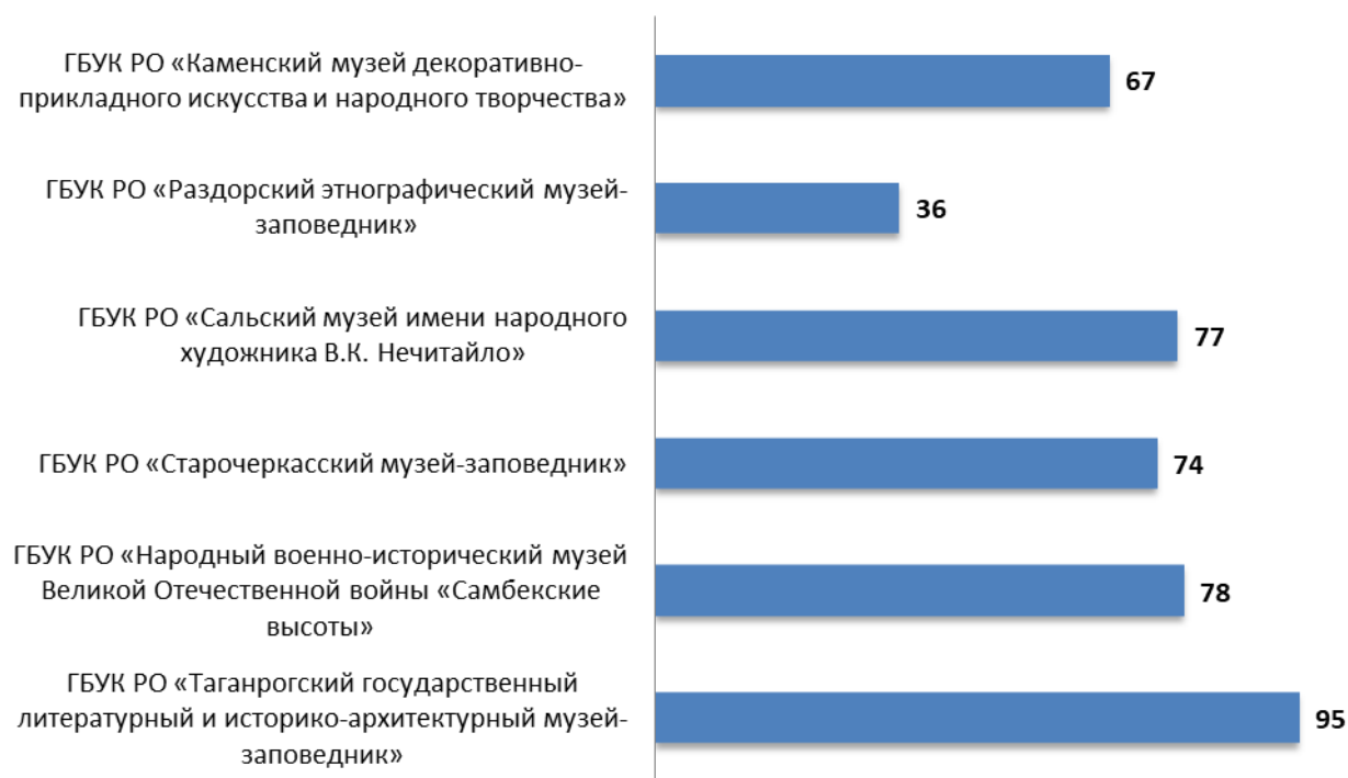
Рисунок 5.1 – Интегральные показатели, характеризующие доступность услуг для инвалидов в организациях культуры Ростовской области, баллы

Анализ интегральных показателей исследуемых организаций культуры Ростовской области показывает, что в отношении доступности услуг для инвалидов зафиксированные оценки параметров демонстрируют значительный разброс: