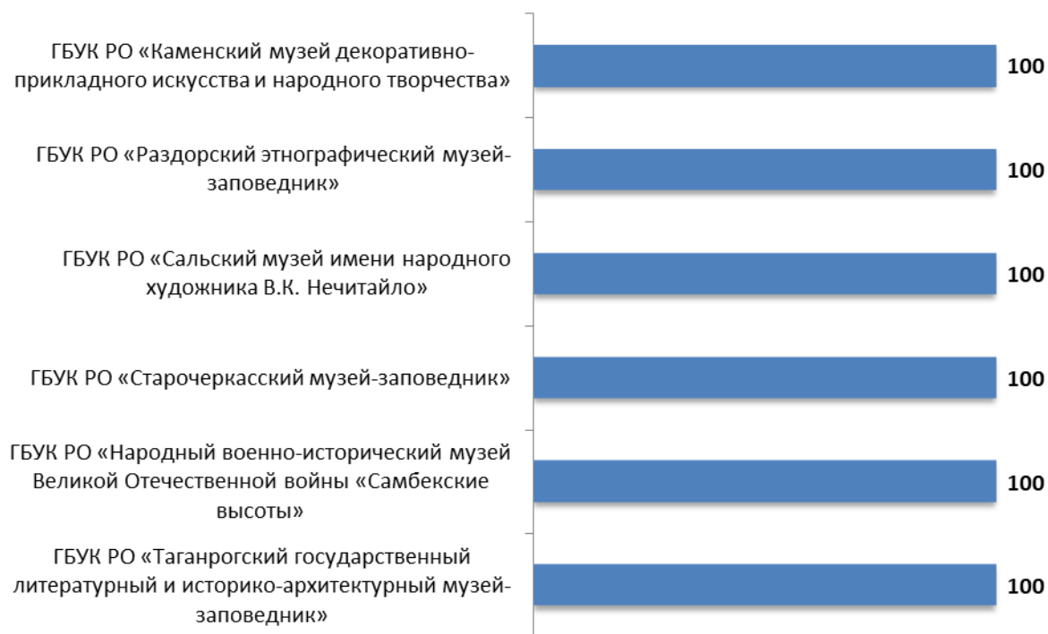
Рисунок 4.1 – Интегральные показатели, характеризующие комфортность условий предоставления услуг в организациях культуры Ростовской области, баллы

Анализ интегральных показателей в организациях культуры Ростовской области показывает, что в отношении комфортности условий предоставления услуг зафиксированные оценки параметров находятся на высоком уровне: