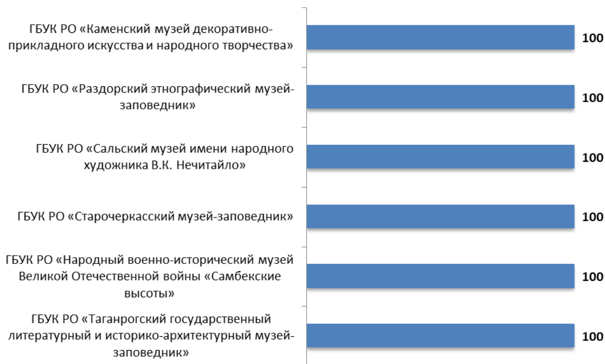
Рисунок 7.1 – Интегральные показатели, характеризующие удовлетворенность получателей услуг организаций культуры Ростовской области условиями оказания услуг, баллы

Анализ интегральных показателей в организациях культуры Ростовской области показывает, что в отношении удовлетворенности условиями оказания услуг зафиксированные оценки параметров находятся на высоком уровне: