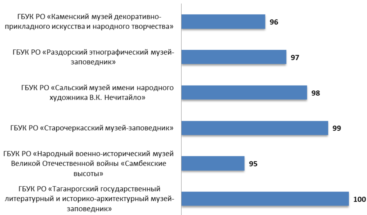
Рисунок 3.1 – Интегральные показатели, характеризующие открытость и доступность информации об организациях культуры Ростовской области, баллы

Анализ интегральных показателей организаций культуры Ростовской области показывает, что в отношении открытости и доступности информации зафиксированные оценки параметров находятся на высоком уровне: